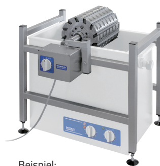
Beispiel: HA 40 mit Ultraschallbad RM 40.2 UH