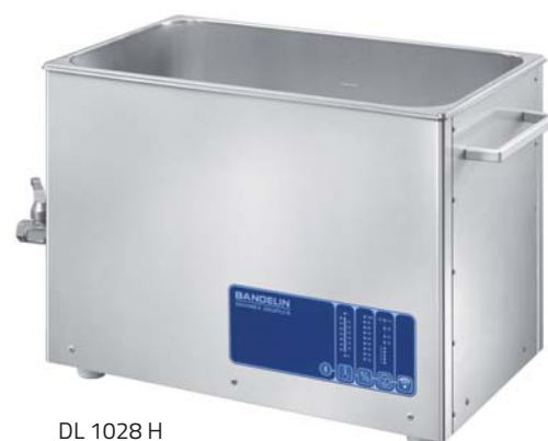
DL 1028 H

Cuves à ultrasons de haute puissance pour nettoyage aux solutions de nettoyage aqueuses