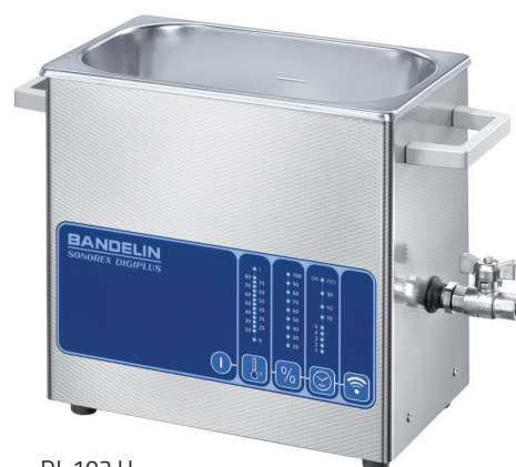
DL 102 H

Cuves à ultrasons de haute puissance pour le nettoyage ou le traitement des échantillons dans solutions aqueuses