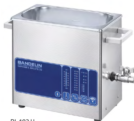
DL 102 H

Cuves à ultrasons de haute puissance pour le nettoyage ou le traitement des échantillons dans solutions aqueuses