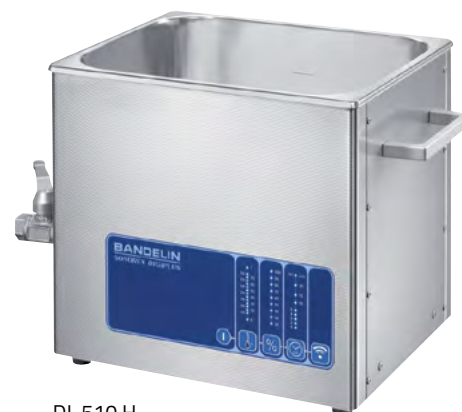
DL 510 H

Cuves à ultrasons de haute puissance pour le nettoyage ou le traitement des échantillons dans solutions aqueuses