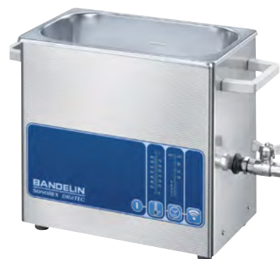
DT 102 H

Cuves à ultrasons de haute puissance pour le nettoyage ou le traitement des échantillons dans solutions aqueuses