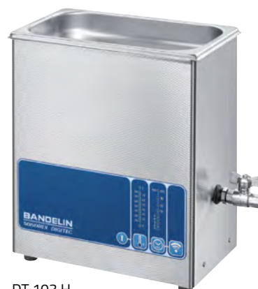
DT 103 H

Cuves à ultrasons de haute puissance pour le nettoyage ou le traitement des échantillons dans solutions aqueuses