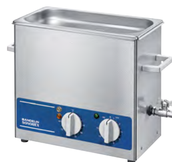
RK 255 H