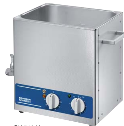
RK 512 H

Cuve à ultrason de haute puissance pour nettoyage aux solutions de nettoyage aqueuses