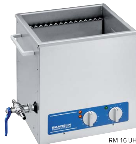
RM 16 UH