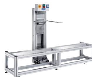
MB 16 mit WG 16-4