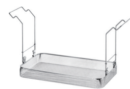
MK 40 B