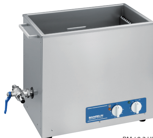
RM 40.2 UH