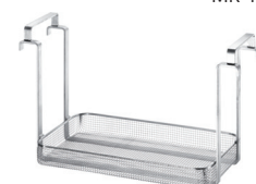
MK 40 S