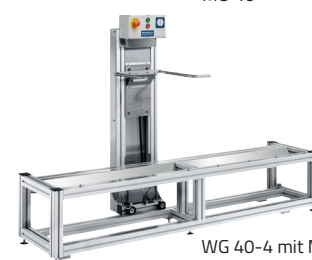
WG 40-4 mit MB 40