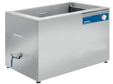
RM 182 H