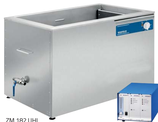
ZM 182 UHL