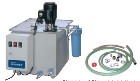
OX 500 + AOX 110/180/210