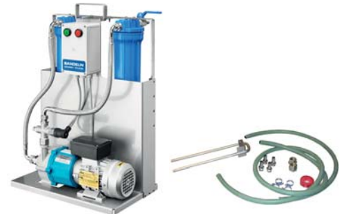
FA 620 + APF 110/180/210