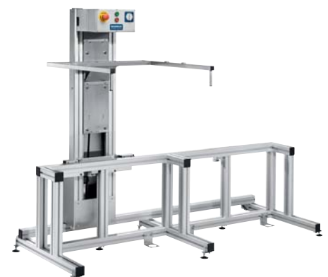
MB 180 B mit WG 180-2