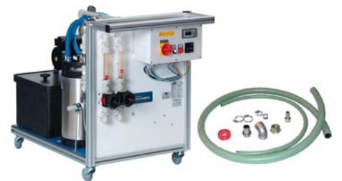
WA 500 + AWA 110/180/210