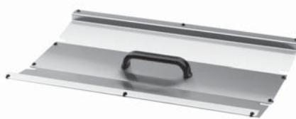
Deckel aus Edelstahl D 1028 C Bestell-Nr.: 3012