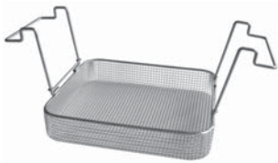
Einhängkorb aus Edelstahl K 14 B Bestell-Nr.: 205