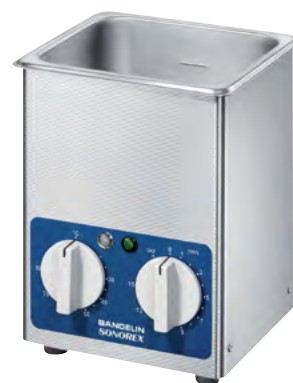
RK 52 H