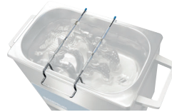
für bis zu 10 Abdrucklöffel